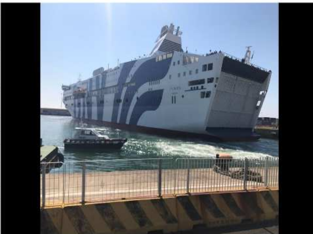
La motonave Splendid ospiterà 1355 operatori