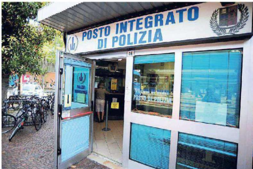
Il Posto Integrato di Polizia è ancora aperto ma gestito esclusivamente dalla polizia municipale

Anche la sala operativa unica del 112 non esiste ancora. In compenso con l'istituzione del numero unico si sono creati passaggi inutili e perdite di tempo per le emergenze: chi risponde deve smistare.