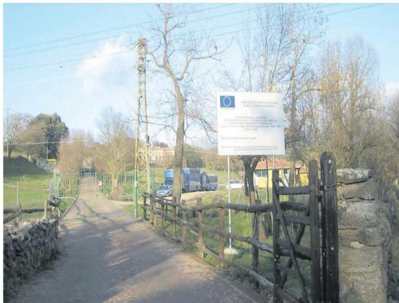
L'ingresso della scuola di polizia a cavallo a Burgos