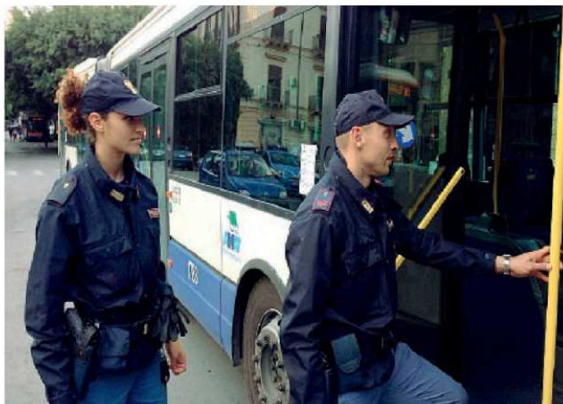
Poliziotti durante alcuni controlli sugli autobus

I due appena completato il colpo sono scesi dall'autobus. La donna si è accorta del furto e ha chiamato la polizia. Poco dopo in altra vettura la stessa scena che si è conclusa con il furto. I due sono stati bloccati dagli agenti della Squadra mobile. Le vittime hanno riconosciuto e i ladri che sono stati arrestati. LANS.