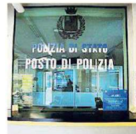
Lo sportello chiuso