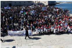
Trani marcia contro la criminalità

«Nei giorni scorsi si è parlato di dedicare un giorno dell'anno alla legalità. Ebbene, io, proporrei di dedicare questa giornata della legalità alle vittime della criminalità piuttosto che ai loro carnefici»