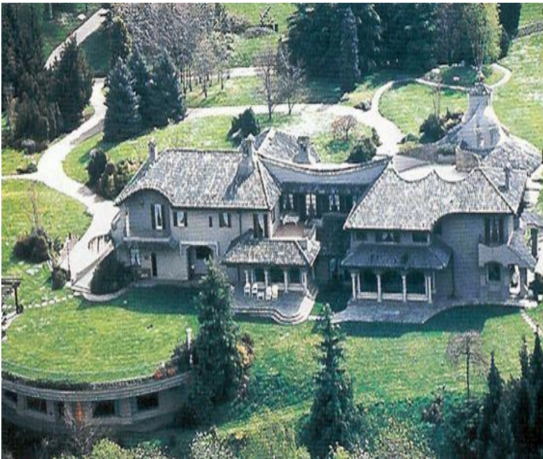
La villa di Adriano Celentano a Galbiate